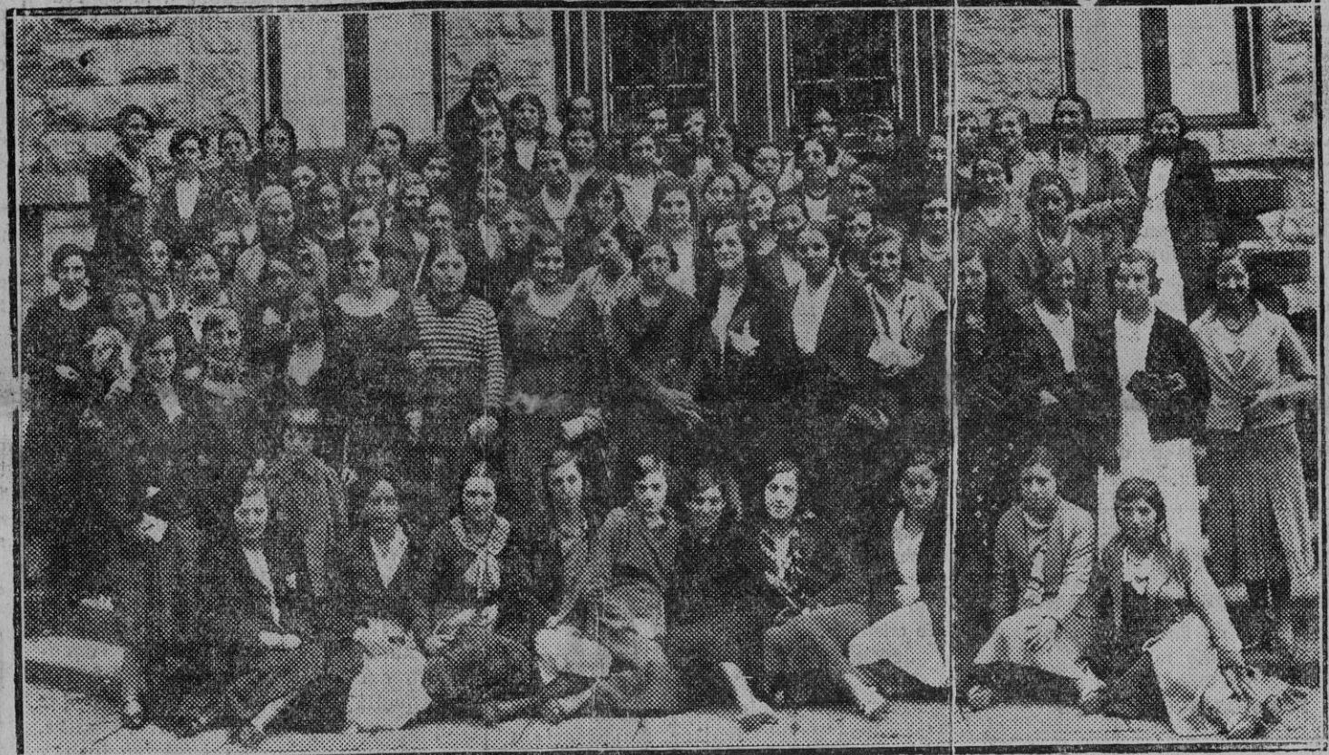
Grupo de Profesoras y alumnas después del acto de apertura del curso. (Foto G. Zaragüeta).