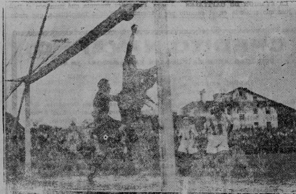
Un ataque donostiarra en el segundo tiempo. (Foto G. Zaragüeta).

PARA EL CUCO LA DE MAS BRILLO Y DURACION