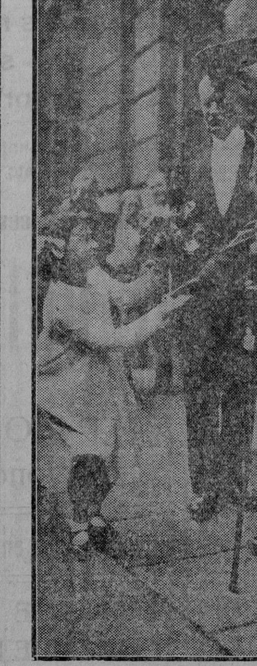
BERLIN.—El 85.º aniversario del Mariscal Hindenburg. Al salir de la iglesia es felicitado por una niña, a la que el ilustre soldado contesta efusivo.

F. Jadraque. Dentólogo. Rayos X. Zócalo de Sarriena 6 y 7. Teléfono 1497