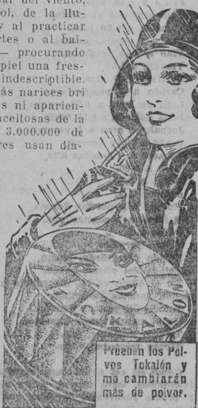
Prueben los Polvos Tokalon y no cambiarán más de polvo.

A pesar del viento, del sol, de la lluvia, y al practicar deportes o al bailar — procurando a su piel una frescura indescriptible. No más narices brillantes ni apariencias aceitosas de la cara. 3.000.000 de mujeres usan diariamente polvos Tokalon, con espuma de crema, los famosos polvos parisienses — actrices célebres, estrellas de la pantalla, bellezas de la sociedad, hermosas mujeres de todos los países. Los Compactos Tokalon contienen ahora espuma de crema. Los Polvos y el Rojo son ambos muy adherentes, algo nuevo, diferente y mejor.