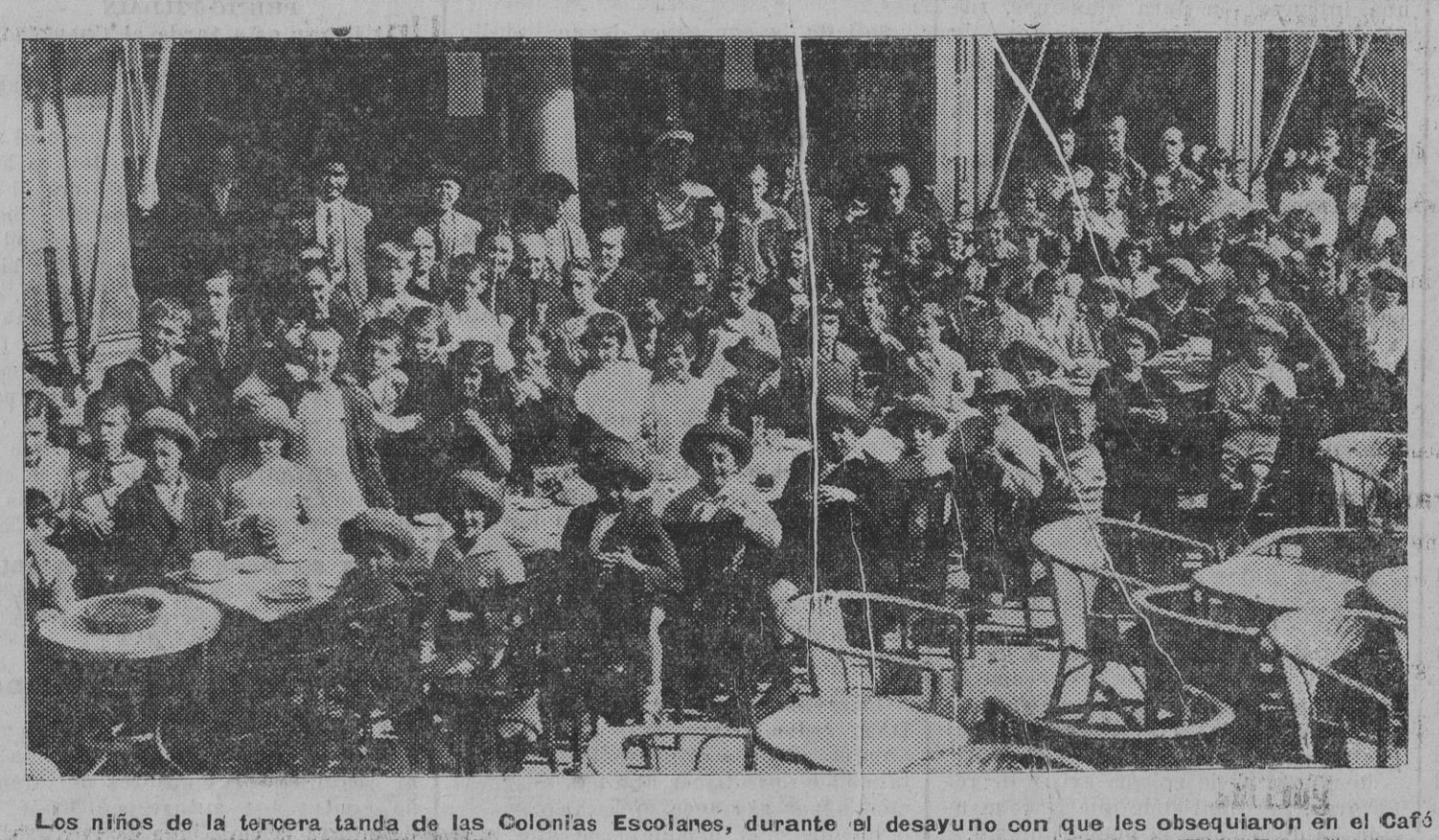
Los niños de la tercera tanda de las Colonias Escolares, durante el desayuno con que les obsequiaron en el Café Iruña antes de partir para las Veintas de Arraiz.