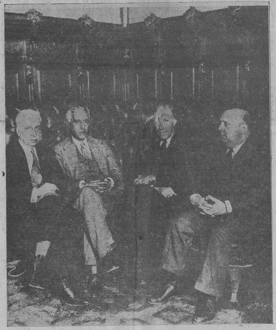
El presidente de la Cámara, señor Besteiro, conferenciando con el señor Maciá, el ministro de Hacienda y el señor Hurtado