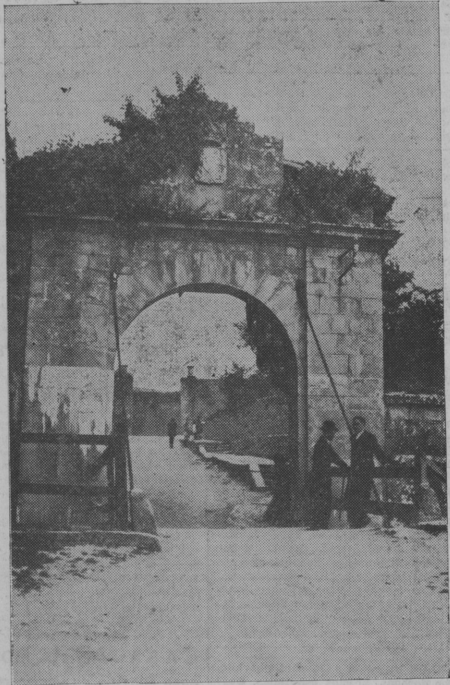
Otro lugar emotivo y artístico del Portal de Francia que también se propiamente "modernizan".