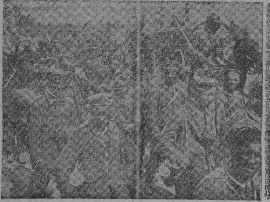
De la guerra.—Conducción de prisioneros alemanes