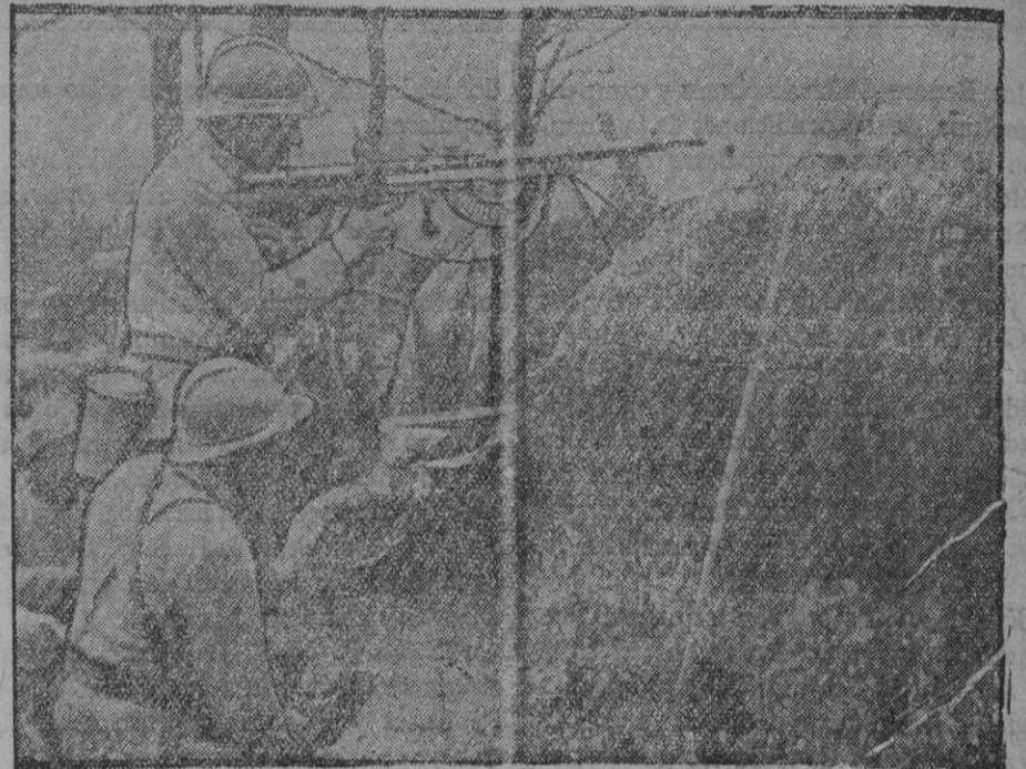
De la guerra.—Trinchera defendida por ametralladoras

Ultima semana de la temporada.—Próximo a terminar la brillante campaña que Enrique Borrás y su compañía viene realizando en este teatro, se darán en estos días las últimas representaciones del admirable drama trágico, de Pinillos, «Eslavitud», que ha constituido el mayor éxito de la temporada, obra que, como es sabido, ha proporcionado al ilustre Borrás uno de sus más clamorosos éxitos. El viernes próximo, con la 30.ª representación de «Eslavitud», tendrá lugar el beneficio de su ilustre autor, «Parmeno». Mañana, día de Año Nuevo, por la tarde, se representará «Eslavitud», y por la noche, y última vez, «La loca de la casa», grandiosa creación de Enrique Borrás.