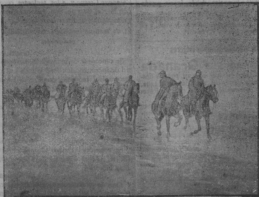
Bañando los caballos en una playa del mar del Norte.

A los desertores corregidos con recargo en el servicio, se les suspenderá la expedición de la licencia absoluta hasta que cumplan el recargo, que lo extinguirán en sus mismos Cuerpos, pero sin poder obtener ascensos, destinos ni licencias, ni más haber que el correspondiente a los soldados por sorteo.