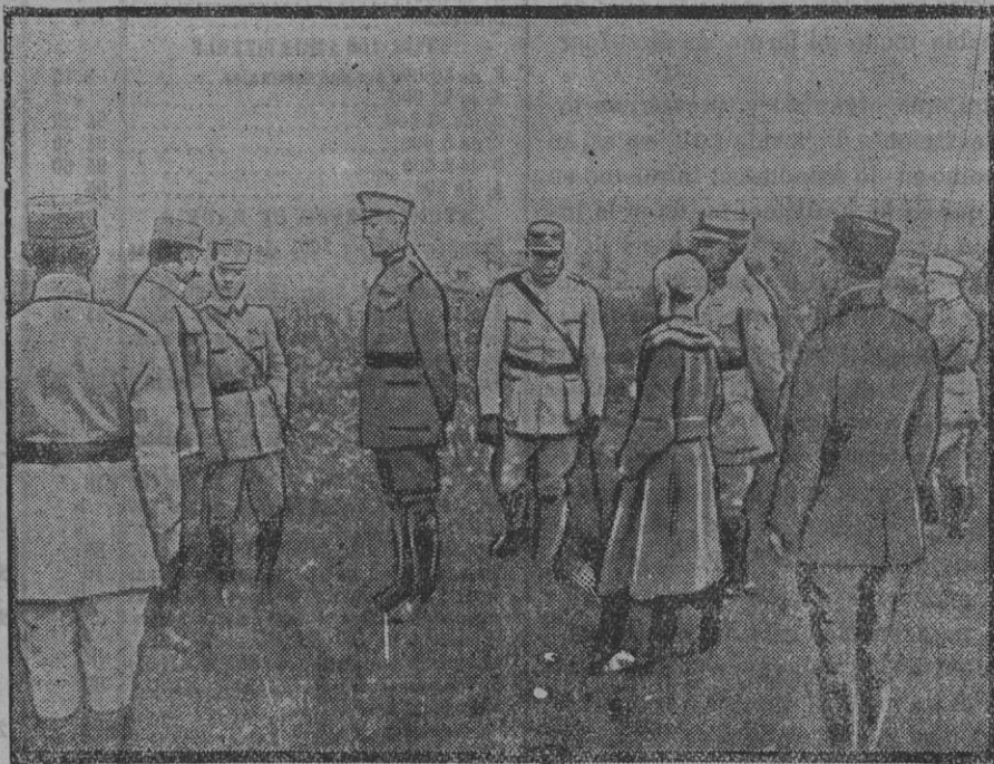
El Rey y la Reina de Bélgica visitando un campo de aviación francés.

Ahora, al reanudarse las facturaciones, volverá á reproducirse la congestión en las líneas si no se adoptan medidas eficaces, como la de prohibir facturaciones de puerto á puerto por líneas férreas.