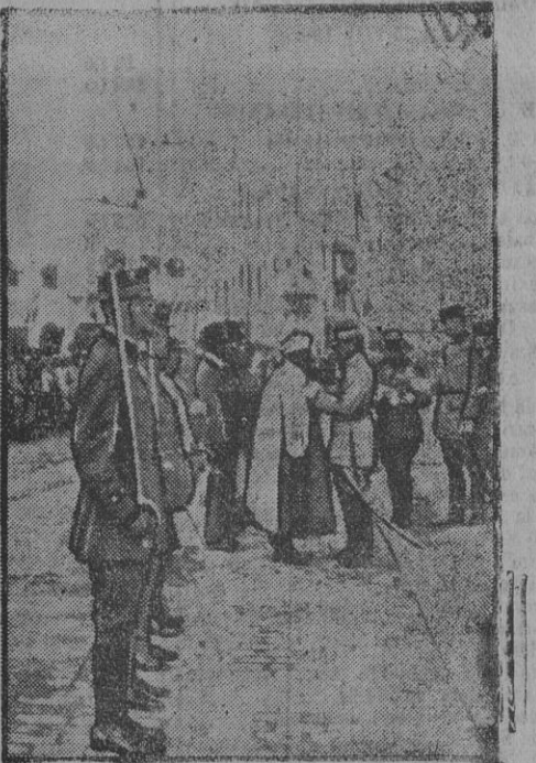
Imposición de condecoraciones en Rabat

El total de prisioneros válidos capturados alcanza la cifra de 311 oficiales y más de 13.000 clases de tropa.