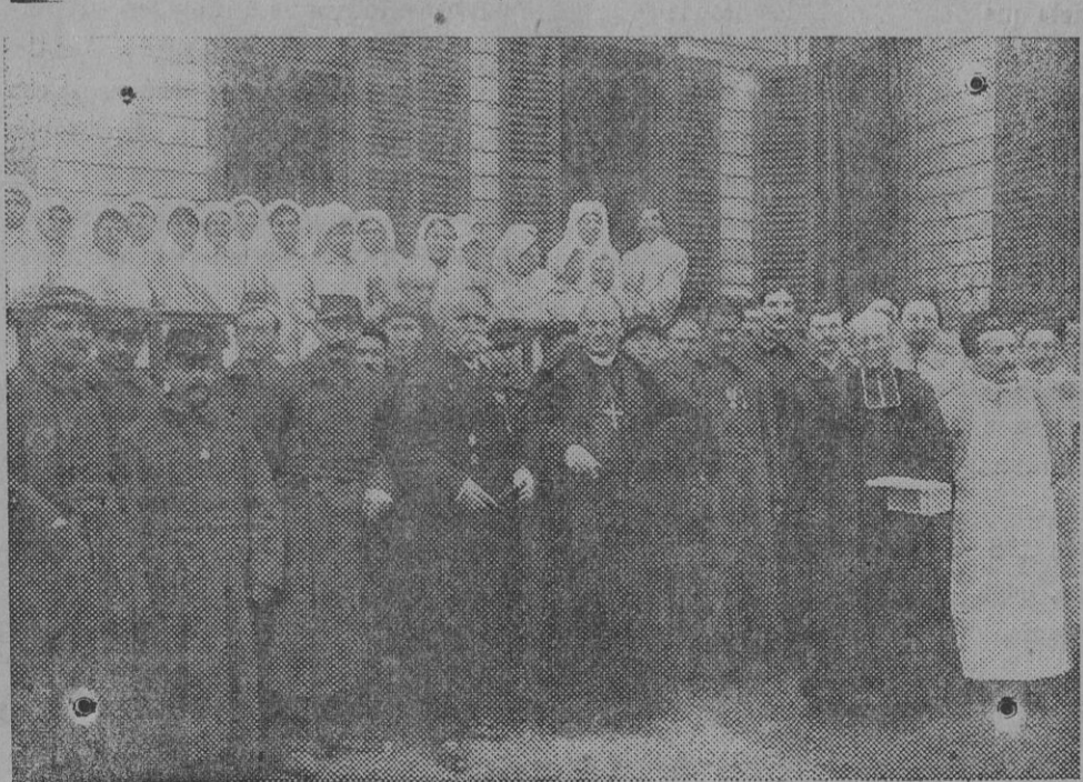
El cardenal Amette visitando un hospital auxiliar.