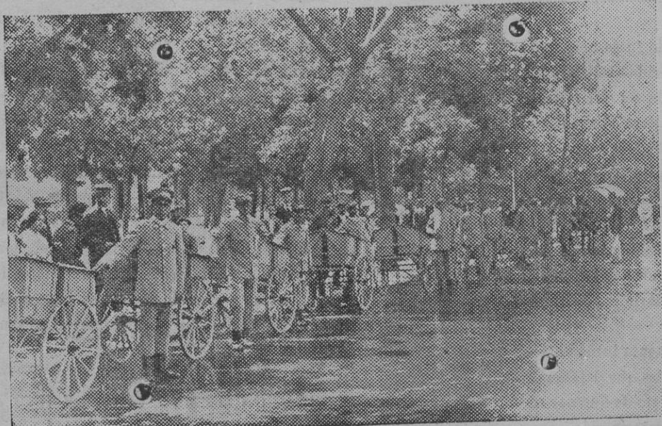
Los nuevos carros de limpieza formados en el Salón del Prado durante la revista.

por sus compañeras de mujer mala, y todas la envidiaban su buena suerte.