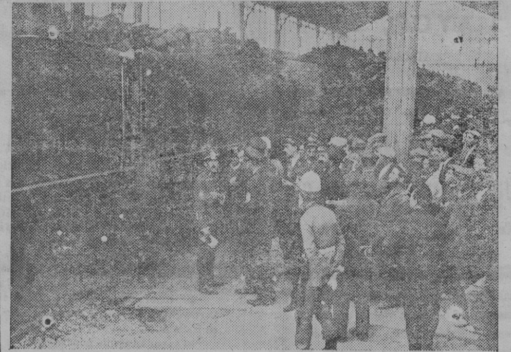
Salida del rápido de Hendaya, cuya locomotora ha ido gobernada por un teniente de Ingenieros y dos soldados del batallón de ferrocarriles.