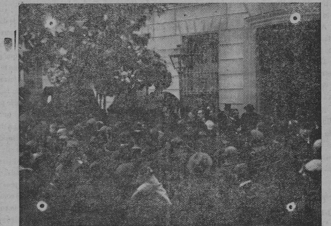
Momento de depositar en la carroza fúnebre el ataúd que contenía los restos mortales del ilustre y queridísimo periodista.

Ayer publicó la «Gaceta una resolución de la Dirección general de Aduanas en la que se dispone que el día 10 del corriente comience a funcionar el depósito franco concedido al puerto de Cádiz por Real decreto de 22 de Septiembre del año último.