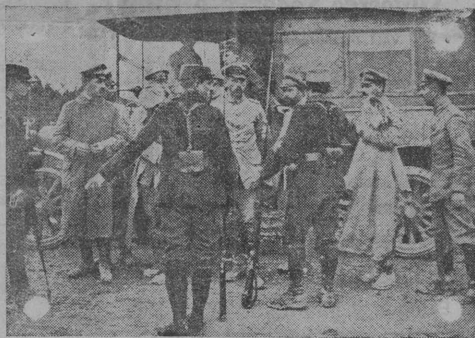
Oficiales alemanes hechos prisioneros en uno de los últimos combates de la Champaña.

Total de gastos de nuestra acción en Marruecos durante los diez meses que van transcurran de este año, 117.987.015,49 pesetas.