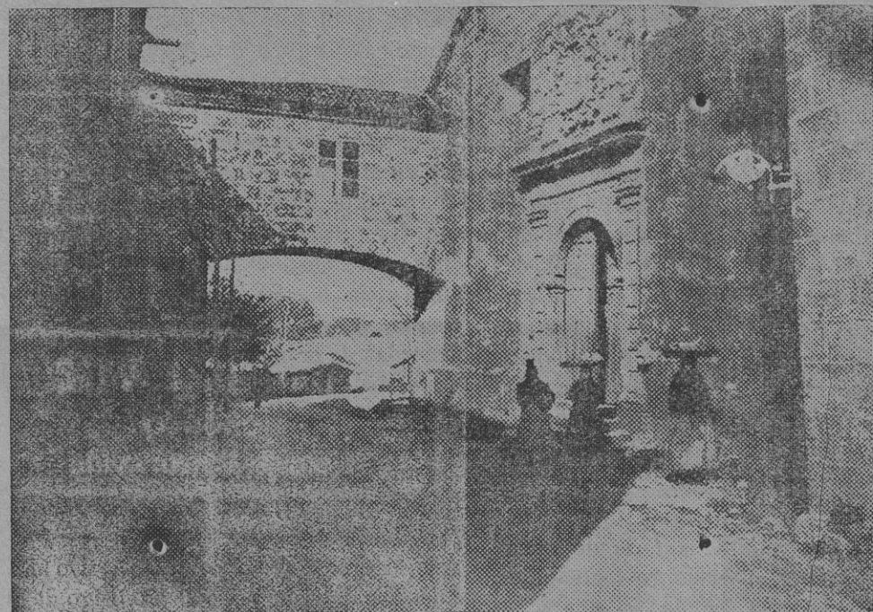
Entrada al castillo de Vista Alegre (Villagarza de Aroca).