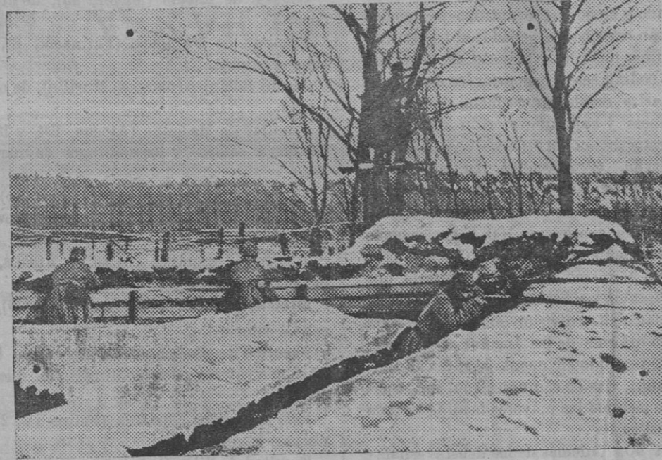
Trincheras de abrigo con puesto de observación en la región de los lagos mazurianos.