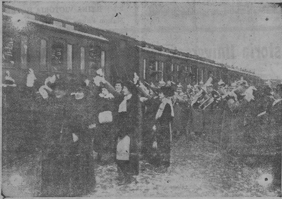
Despedida de los reservistas alemanes que van a cubrir bajas en la línea de fuego de Bélgica.

Así estaremos pronto en condiciones de que la defensa nacional sea eficaz con nuestros propios recursos y de constituir el Ejército con la proporción debida para cada una de las armas.