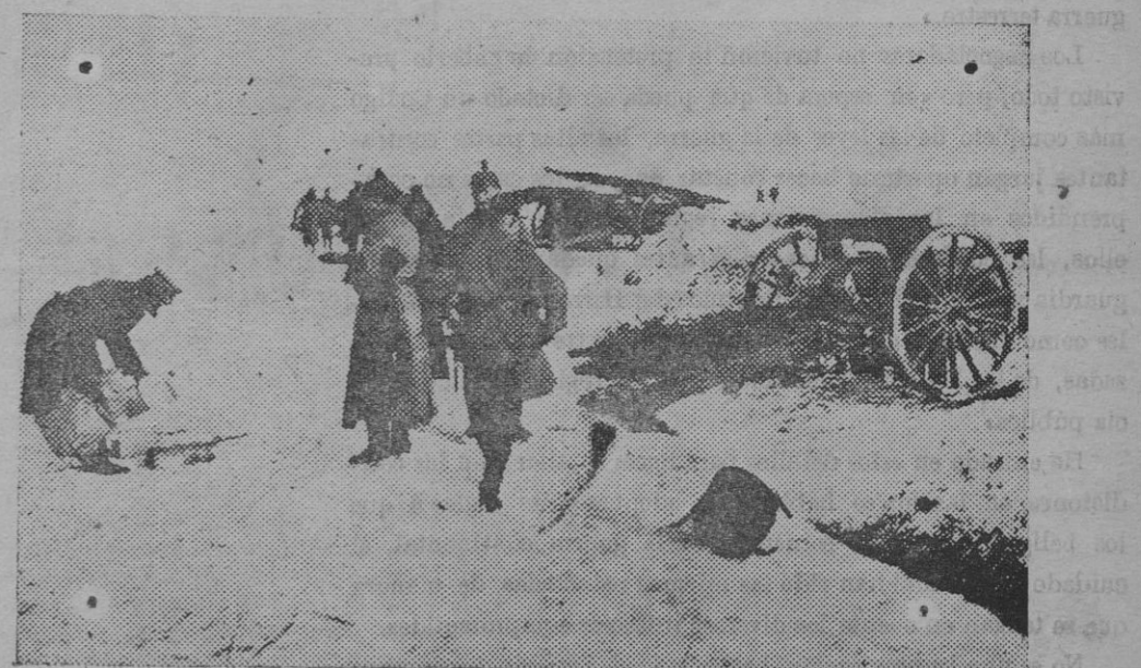
Posición de artillería alemana en un campamento cercano á Varsovia.

NOTA.—Se dará cuenta en la sección de «Libros» de aquellos libros, folletos y revistas, cuyos autores ó editores remitan dos ejemplares.