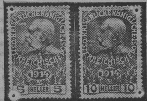
El nuevo sello creado por la Administración postal austriaca, cuyo producto se destina a la Cruz Roja.