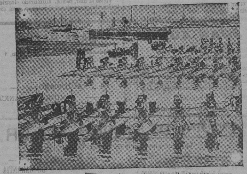
Flotilla de submarinos ingleses, en el puerto de Portsmouth.

Si el cuerpo ó unidad designada al efecto para proveer de fondos á dichos oficiales, con el expresado fin, careciese de ellos, le será librada la cantidad que