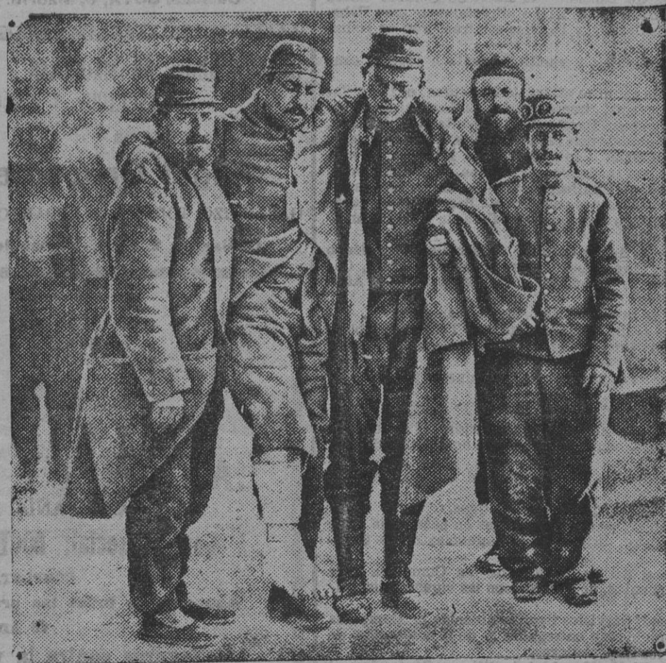
Soldado alemán herido y conducido por soldados franceses a una ambulancia.