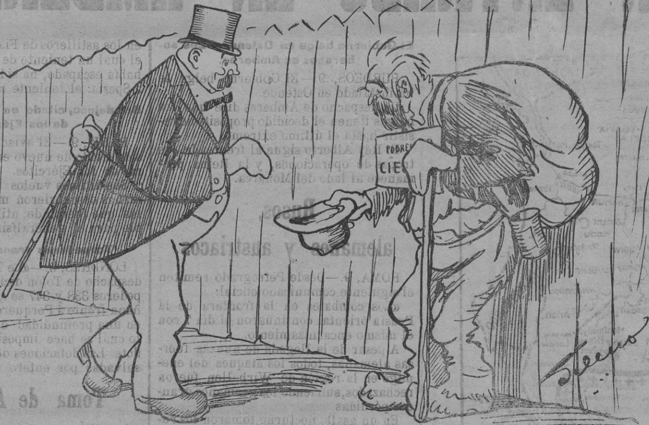
—Dios le dé a usted salud y suerte hasta que termine la batalla del Aisne — ¡Y usted que lo vea, hermano!