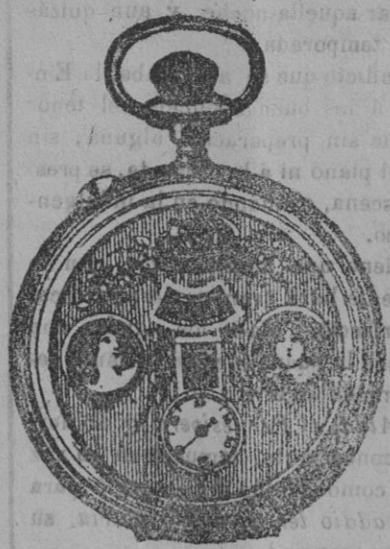
El maravilloso reloj automático

Contiene la legislación vigente, con la jurisprudencia sentada por dicho alto Tribunal, y por el de lo Contencioso Administrativo; formularios y un apéndice. 5 pesetas. En provincias, 5,50, franco y certificado.