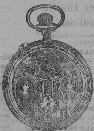
El maravilloso reloj automático

THIERRY.—GRAN RELOJERÍA DE PARÍS FUENCARRAL, 59.—MADRID