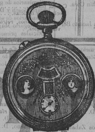
El maravilloso reloj automático.

THIERRY.—GRAN RELOJERIA DE PARIS FUENCARRAL, 59.—MADRID