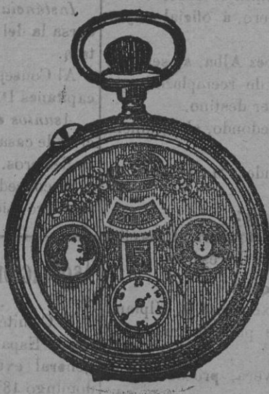
El maravilloso reloj automático

Gran Relojeria de Paris FUENCARRAL, 59.—MADRID Apartado de Correo, 436 La última novedad; sin manilla ninguna, marca las horas y minutos con claridad; máquina fuerte de áncora, precisión. Tiene dos aplicaciones fotográficas que se cierran con cerquillo-medallón que se puede abrir y poner la fotografía que se quiera como recuerdo. Caja de acero azulado, semiplano; todas estas combinaciones forman un conjunto artístico tal, que no hay reloj más bonito que éste que presenta el conocido industrial L. THIERRY. Aparte de su belleza artística, es de máquina de precisión y seguridad. Su precio es de 35 pesetas en seis plazos mensuales. Va por correo certificado, con aumento de 1,50 pesetas por franqueo. THIERRY.—GRAN RELOJERIA DE PARIS FUENCARRAL, 59.—MADRID