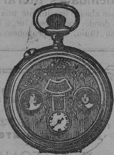
El maravilloso reloj automático.

La última novedad; sin manilla ninguna, marca las horas y minutos con claridad; máquina fuerte de áncora, precisión. Tiene dos aplicaciones fotográficas que se cierran con cerquillo-medallón que se puede abrir y poner la fotografía que se quiera como recuerdo. Caja de acero azulado, semiplano; todas estas combinaciones forman un conjunto artístico tal, que no hay reloj más bonito que éste que presenta el conocido industrial L. THIERRY. Aparte de su belleza artística, es de máquina de precisión y seguridad. Su precio es de 35 pesetas en seis plazos mensuales. Va por correo certificado, con aumento de 1,50 pesetas por franqueo.