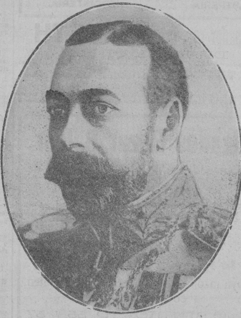
LONDRES.—El Rey Jorge V de Inglaterra que se encuentra gravemente enfermo