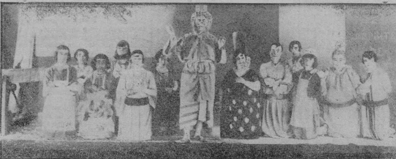
MADRID.—Una escena de la obra 'El Diluvio', estrenada en el Teatro de la Comedia con gran éxito.

Todo cuanto sea propulsión de cultura, todo lo que tienda a elevar el nombre de nuestra ciudad, para todos debe ser mirado con el máximo respeto y la mayor benevolencia.