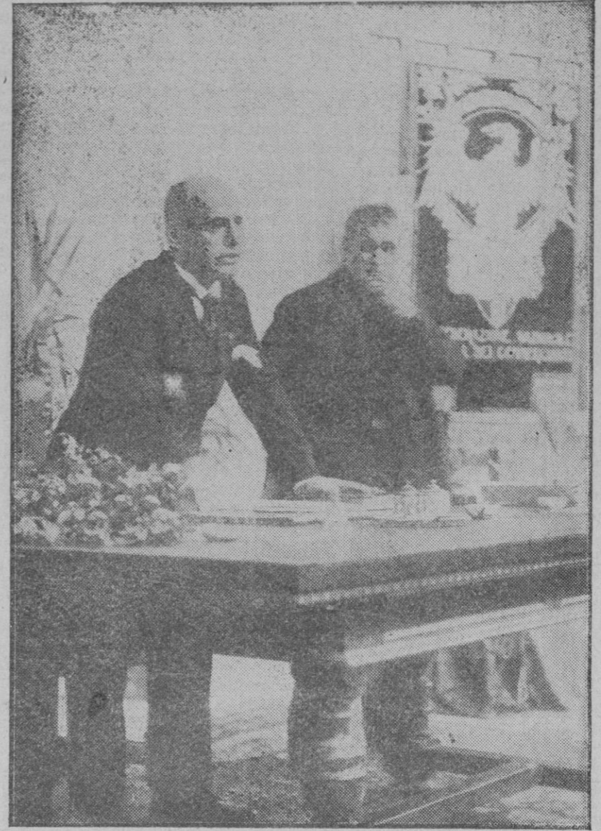
ITALIA.—Mussolini pronunciando un discurso al inaugurarse la Confederación Nacional Fascista del trabajo.