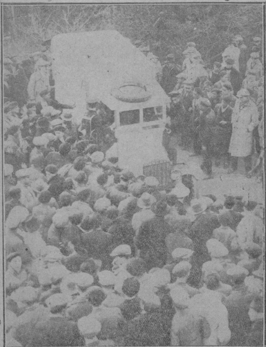
MADRID.—Soldados de la Cruz Roja recogiendo a uno de los corredores que resultó herido en la carrera motorista de la Subida de la Dehesa de la Villa.

El 23 de septiembre, día de la Expiación de los judíos, éstos colocaron