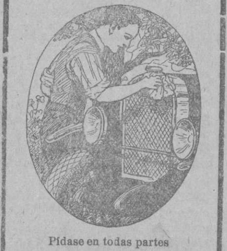
Pídase en todas partes

AUTOMÓVILES desde 1.000 hasta 22.000 pts.