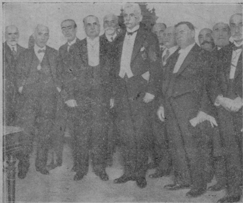
MADRID.—Don Tiburcio Alsraón, prestigioso hombre de ciencia que al ser recibido en la Academia de Medicina dijo sobre la «Multiplicidad y complejidad de los efectos fisiológicos, terapéuticos y tóxicos de los medicamentos en clínica médica veterinaria», dando una prueba de sus profundos conocimientos.