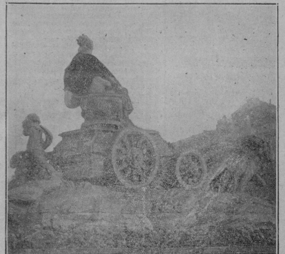
MADRID.—El rasgo de humorismo de un madrileño que durante la noche ha colocado una silla o una capa española en los hombros de la Cibele, a pesar de que el estanque circular que rodea la efigie de la diosa se hallaba lleno de agua. Los bomberos que acudieron a despojar la estatua de su prenda de abrigo, se han visto en un caso de apuro para conseguir su propósito.