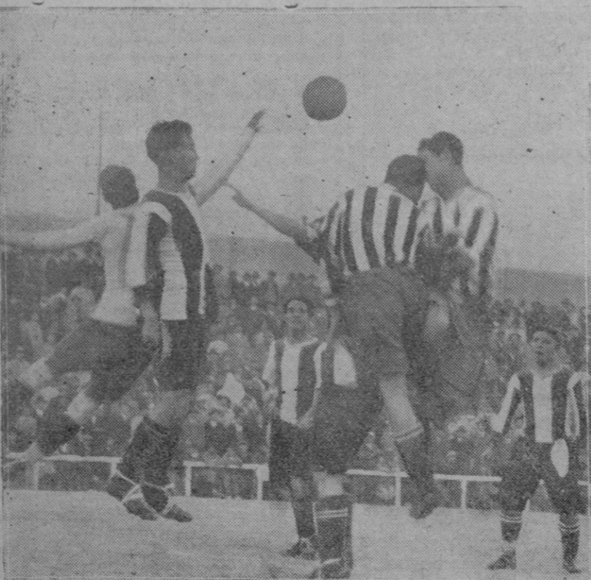
MADRID.—Una oportuna intervención del portero del «Nacional», en el partido jugado contra el «Athletic», del que resultaron vencedores los últimos por 1 a 0.