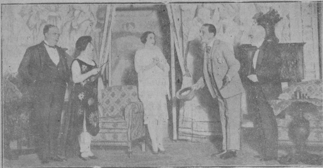
MADRID.—Una escena de la comedia de Suárez de Deza, «Te quiero, te adoro», que ha sido estrenada en el Teatro Infanta Beatriz.