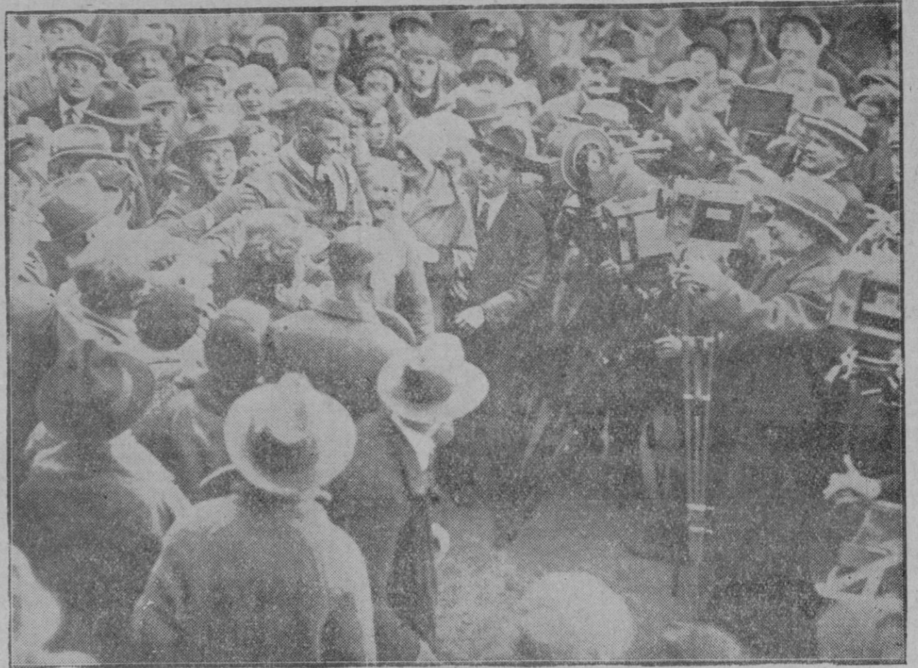
FRIEDRICHSHAFEN.—El polsón que embarcó en Nueva York en el dirigible «Conde Zeppelin» al llegar a esta ciudad es recibido entusiastamente por la multitud, mientras los operadores cinematográficos le asedian para retratarle en las películas.