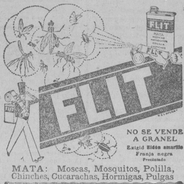
MATA: Moscas, Mosquitos, Polilla, Chinchas, Cucarachas, Hormigas, Pulgas

No tan sólo, no ha desaparecido ni desaparecerá, (D. m.), este negocio, sino que se ampliará y perfeccionará con nuevas secciones, para corresponder dignamente al creciente favor de su distinguida y numerosa clientela.