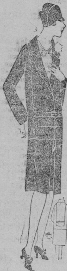
Un hermoso modelo para señoritas.