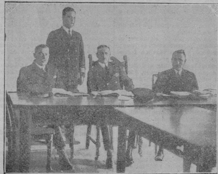
Los generales norteamericanos reunidos en sesión para depurar las responsabilidades por el hundimiento del submarino S-4.