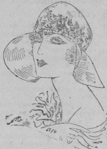
SOMBREIRO.—He aquí para los días de gran sol la inmensa y muy femenina capelina de paja de Italia...