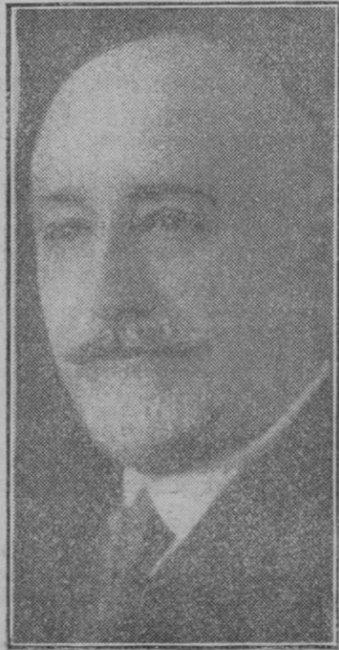
Paul Daumer que ha sido elegido Presidente de la Alta Cámara francesa.