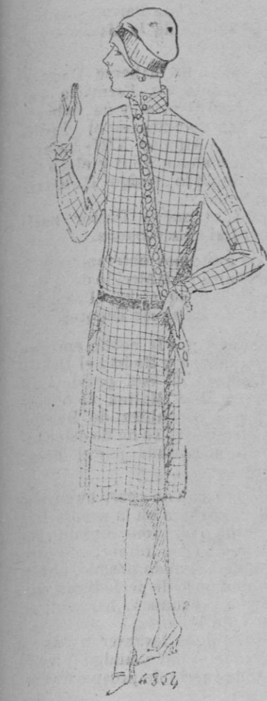
VESTIDO PARA LA MONTAÑA.— Vestido de lana cuadrada...