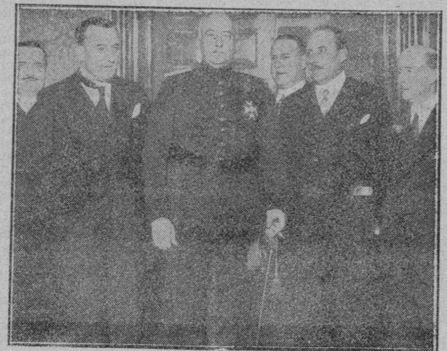
MADRID.—En el local de la Unión Patriótica dió una conferencia el ilustre escritor don Ramiro de Maeztu sobre «un programa social de Unión Patriótica». Asistió el Presidente del Consejo y otras personalidades.

Añade el anuncio en cuestión que se garantiza la operación quirúrgica, que será practicada por los más eminentes cirujanos de los Estados Unidos.