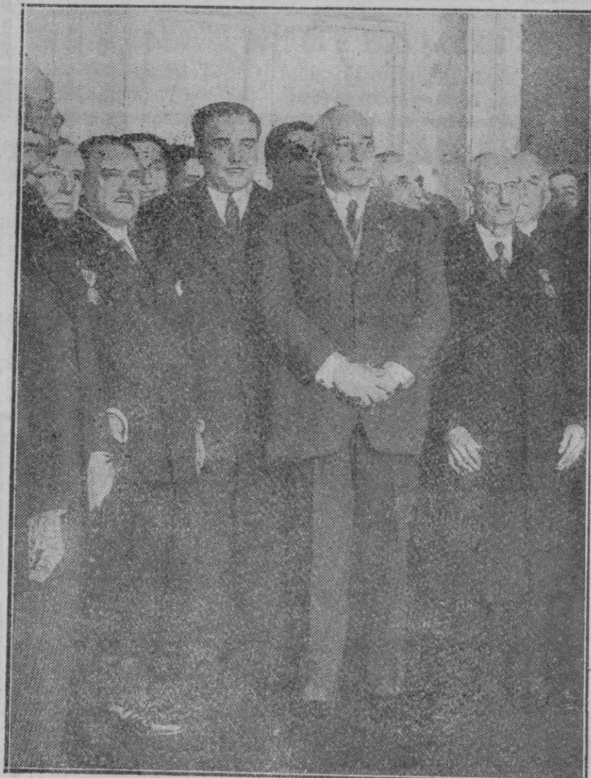
MADRID.—Acto de imposición, al Presidente del Consejo de la Medalla del Trabajo, constituyendo una sencilla solemnidad.

existencia en el líquido. Como el insecto permanece fijo, los peces pasan muy cerca, sin temor, pero tan pronto como uno de ellos se acerca a las patas que a modo de tentáculos flotan sobre el agua, la araña lo aprisiona y lo saca del agua, comiéndoselo lentamente.