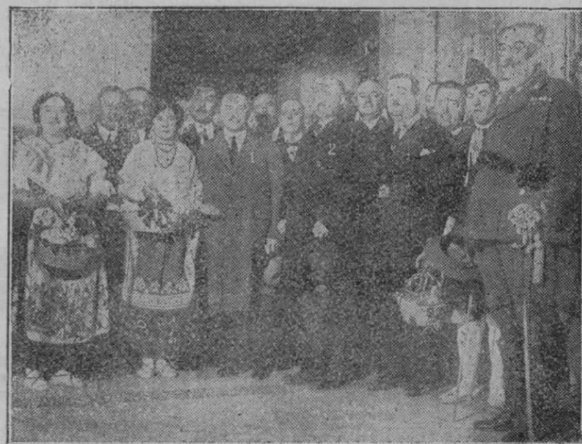
MURCIA.—Llegó el Ministro de Fomento para inaugurar la Confederación Hidrográfica del Segura. En esta fotografía se ve al Ministro (1) con el Alcalde (2) rodeados de una bellísima representación de huertanas.