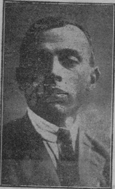
El famoso campeón ciclista Octavio Bottechia que ha muerto a consecuencia de las lesiones que sufrió al chocar con un automóvil.