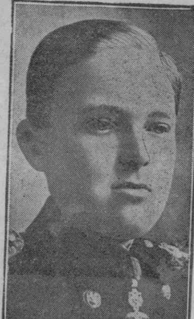
S. A. R. el Príncipe de Asturias, que ha sido nombrado Presidente de Honor de la Feria de Muestras que ha de celebrarse en Gijón.