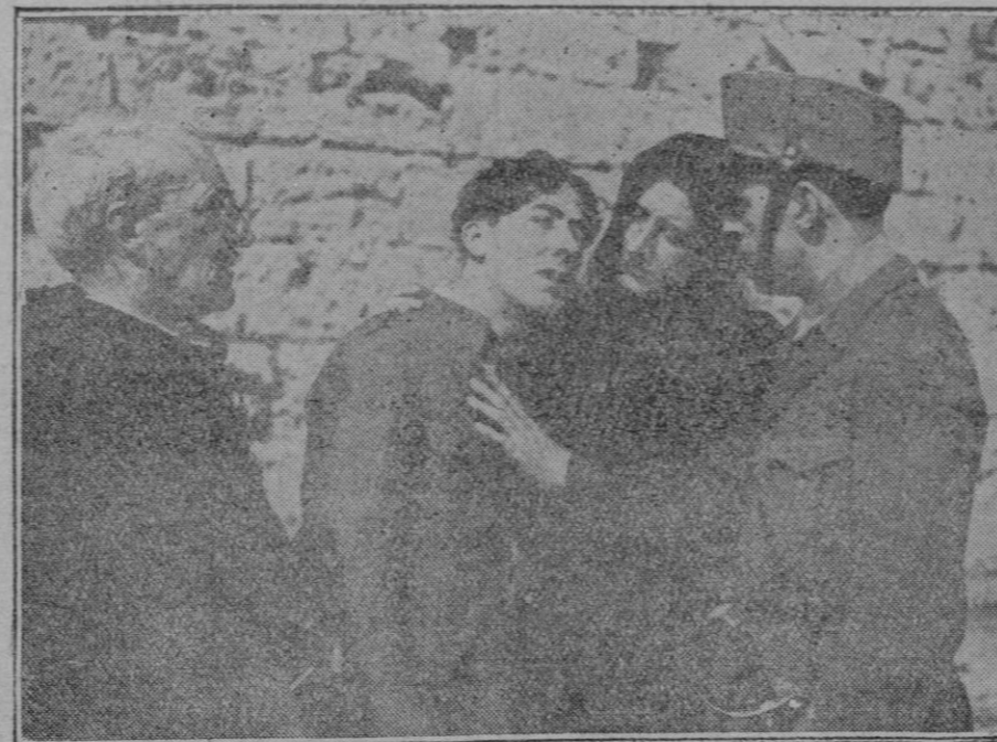
Dos interesantes escenas de la película mallorquina «La bala siniestra» cuyo estreno, que tendrá lugar mañana en el Teatro Lírico, es esperado en Palma con mucho interés.