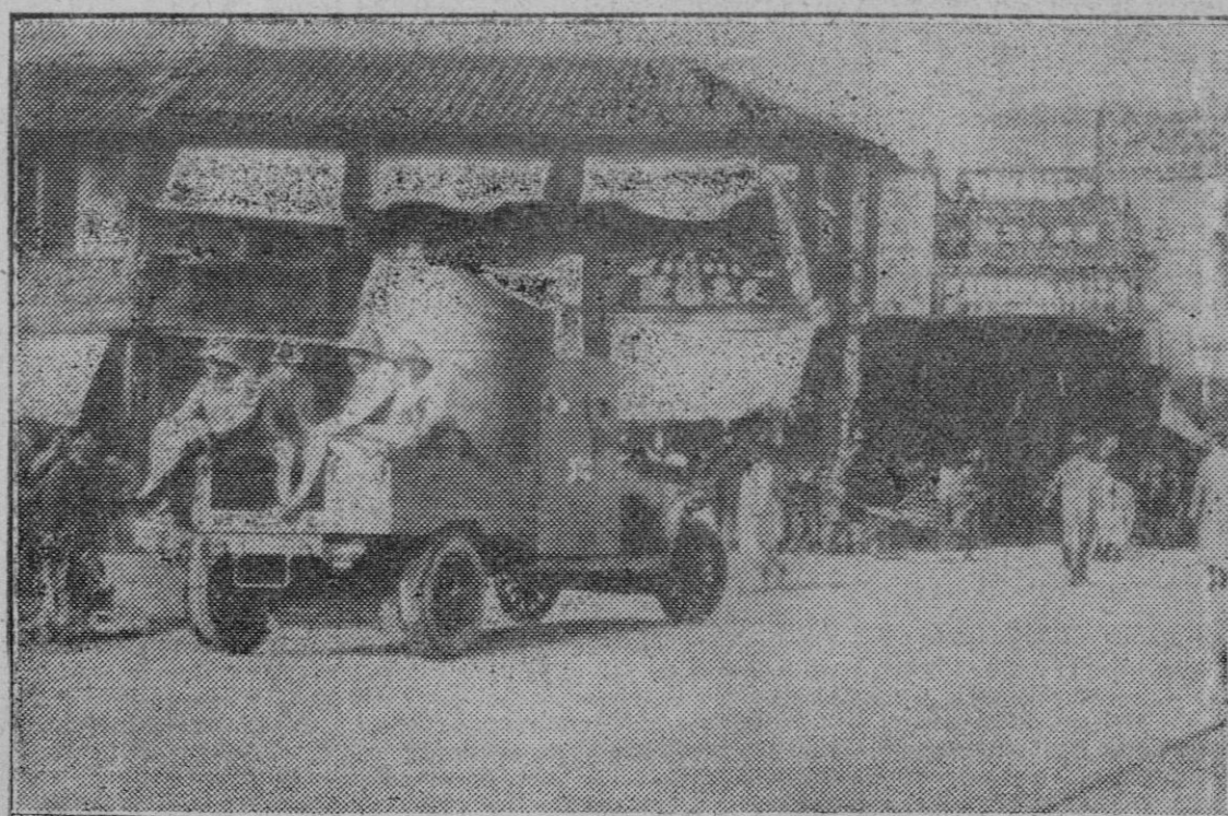
LOS SUCESOS DE CHINA

Cuantos anuncios ha leído V. hoy de la CASA MATONS.