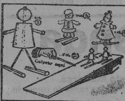
Fabricar muñequitos con dos corchos atravesados por una horquilla como enseña la figura 1. Separar los extremos de la horquilla que van insertos en un escarbidente. Con dos fósforos se hacen los brazos. Luego se visten los muñequitos pegando piezas de papel, de seda. Prepárese una tablilla fina, y dispóngase a manera de trampolín sobre una mesa, apoyándolo en un libro.

Colóquense los dos muñequitos, uno al lado de otro, y golpeando con un palito el trampolín, se hará correr a los muñecos como muestra la figura 2.