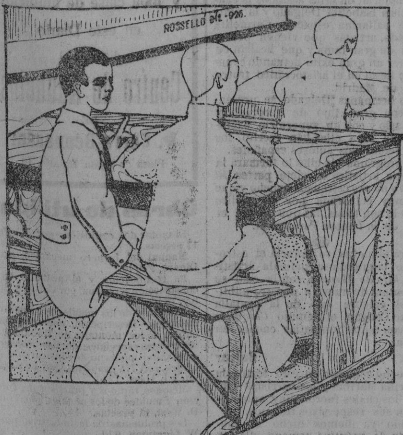
No te dije que el Maestro iba a cometer una tontería? Pues mira, seguidamente me ha dicho: —Por hablador te pones el último de la clase.

devorar. Pero el oso, para apaciguarlos, dijo a la hermosa niña: —No mires atrás, ni a la derecha, ni a la izquierda; sigue derecha y no temas!