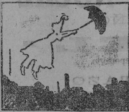
La silueta de esta niña puede cubrirse totalmente con los fragmentos negros recortados del grabado. Traten de hacerlo mis hábiles nietecitas.

Los hijos obedientes y buenos, son siempre premiados por Dios.