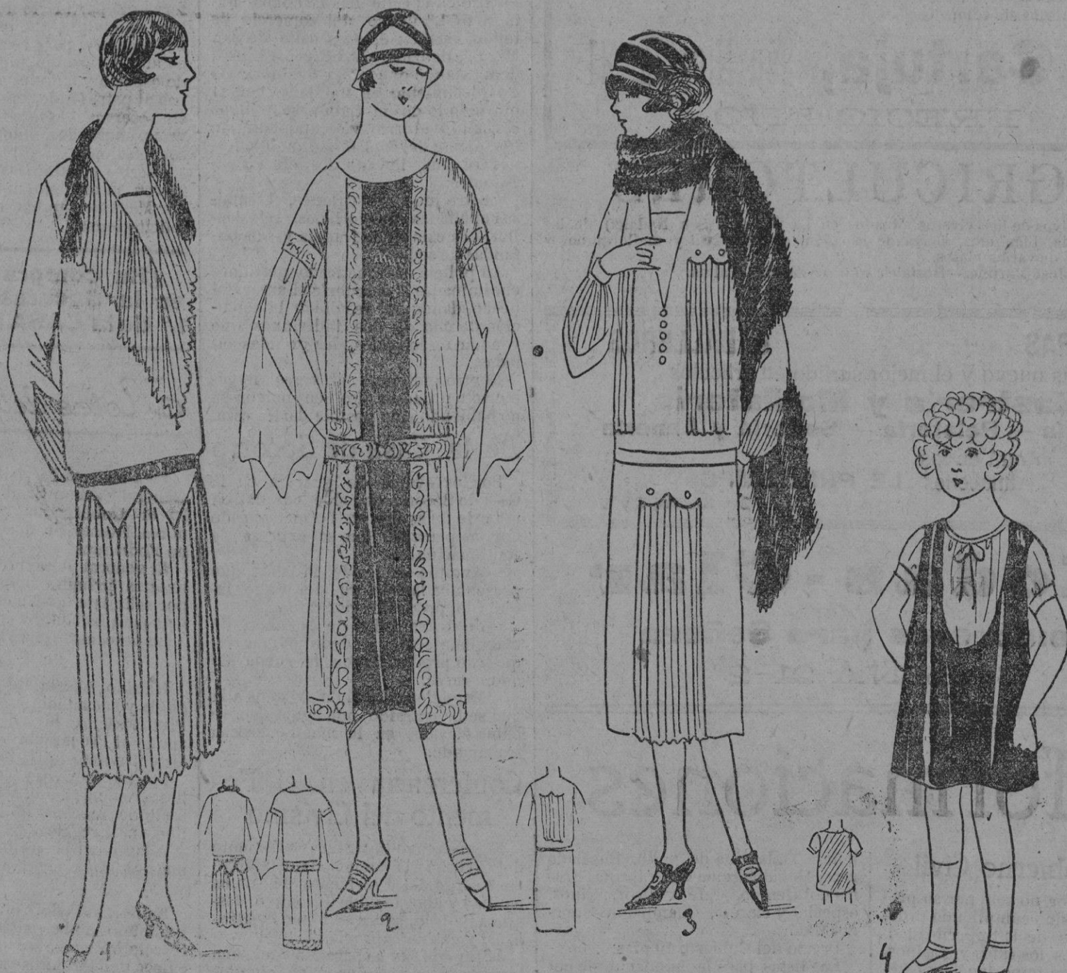
PAORAMA TOALETAS.—1 Traje de crepé de china azul rey, hecho con un cuerpo recortada en punta y colocado picado sobre una falda plisada. La manga es hecha con el mismo. Metraje 5 m. 50 de 1 m.—2 Sobre un forro de satén negro de 1 metro 50 por 1 metro, se colocó el traje en dos partes, a fin de que la falda tenga más amplitud y reliaadas entre ellas por el cinturón. Este traje será de velo de seda gris y el galón que orla de acero bordado. Metraje 4 m. de 1 m.—3 Un forro recto, los dientes del cuerpo y de la falda son cortados en el paño mismo y los plisados reunidos son pasados por debajo. Es un poco el efecto del bolero.—4 Para una niña hacer un espacio de encaje de crepé de china, sobre el que se colocará sencillamente este traje de terciopelo azul marino. Metraje 0 m. 75 de crepé de china blanco y 1 m. de terciopelo de 1 m.

—La tela que goza de mayor apogeo en el terciopelo. La moda lo impone en vestidos de un solo color,