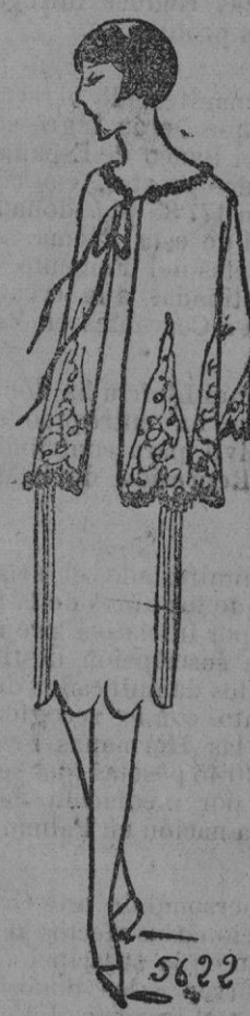
ABRIGO PARA INTERIOR.—Sobre hermosas combinaciones, componiendo interiores encantadores para los viajes, colocar este vestido hecho con tisu sedoso y se habrá combinado un gracioso traje de interior. Estos se adornan con plisados de calados, incrustaciones y se orlan sencillamente con un biel azul. Sobre una combinación rica, colocar un pequeño paileto de encaje cereado, orlado con una estrecha banda de piel y anudado con una cinta del mismo tono.