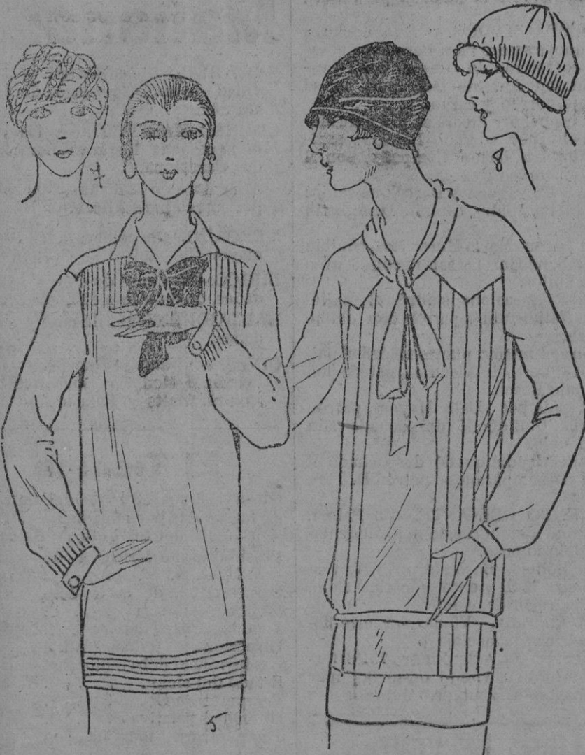
BLUSAS Y BONETES.—5 Camisero de crepé azul cielo, corbata azul oscuro. Metraje 2 m. 25.—6 Camisero de tela de seda azul medio, aplique y pliegues. 2 m. 50.—7 Bonete de muselina y encaje de plata.—8 Bonete de crepé azul encaje y pliegues.

En la misma colección hemos visto dos lindos vestidos de crepón; el primero es de crepón de chino color palo de rosa de dos tonalidades; el segundo, de crepón georgette y terciopelo negro, realizado con un delicoso cinturón de strass.