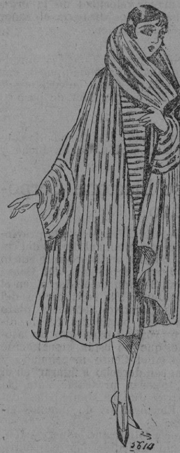
CAPA DE PIEL.—De lanvin es esta maravilla de capa de seda toda de hermina. A notar el reverso dibujado y los puños orlados de varios rangos de pieles en forma.