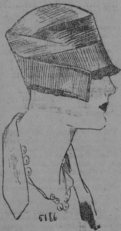
SOMBRERO.—Un modelo de Molinoux, de bangkok, adornado con grano grueso.

volidad y que con frecuencia están inspirados por un criterio eminentemente práctico.