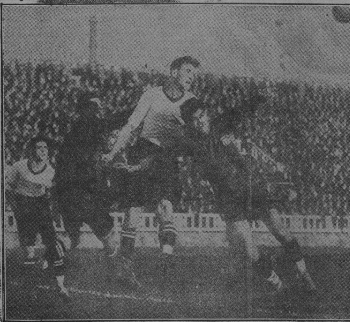
BARCELONA.—CAMPEONATO DE FUTBOL

El molino de las veinticuatro piedras totalmente anegado durante la reciente inundación.