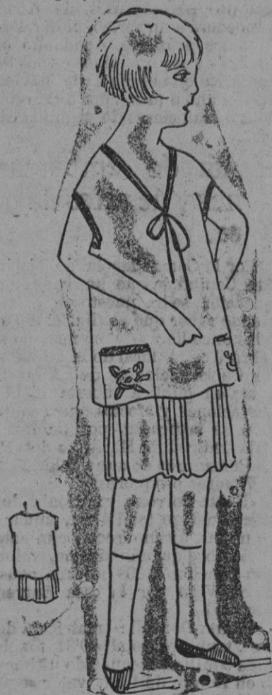
VESTIDO DE NIÑO.—Aquí tiene para nuestra amiguita una preciosa casaca de paño blanco sobre una falda plisada. La casaca bordeada de paño rosa, tendrá bolsillos bordados de lana del mismo rosa con las hojas marrón. A punto de plumeris esta pequeña ejecución de trabajo es asunto de un día todo comprendido y que encantadora estará la niña que lleve con chic este vestido.

Si la contestación es afirmativa, la empleada da dos cortes rápidamente y antes de que la señora pueda evitarlo, en la cabellera. Y de esa forma ya no hay casos de arrepentimientos tardíos, con lo cual los oficiales ganan tiempo y dinero.