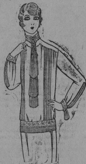
BLUSA.—Blusa de crepé de china blanco y de encaje ocreado.

Numerosas modistas componen ellas mismas cintas extremadamente originales anchos galones alternando la gamuza con el grueso grano y recubiertos con bordados de cordelería o de metal.