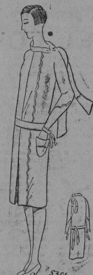
VESTIDO.—Un vestido de carha a tonos la extremidad con presillas se incrusta en anchos dientes sobre el vestido más frunciado; un pliegue hueco delante de amplitud a la marcha. El cuello forma echarpe está anudado lo mismo la cintura. Abajo se ve de nuevo la incrustación. Un bolsillito a un lado.

Vemos algunas mujeres enamoradas de originalidad, adoptar el «béguin» con un gusto muy seguro, conviene a maravilla a la «pequeña cabeza de cabellos planos o rizados». Durante la noche hace una seria competencia al turbante pues es la ocasión de interpretaciones plásticas y armoniosas. Puede convertirse en ciertas ocasiones en el tocado ideal para el teatro, se reborda en este caso o se incrusta con pedrería, perlas o pajitas.