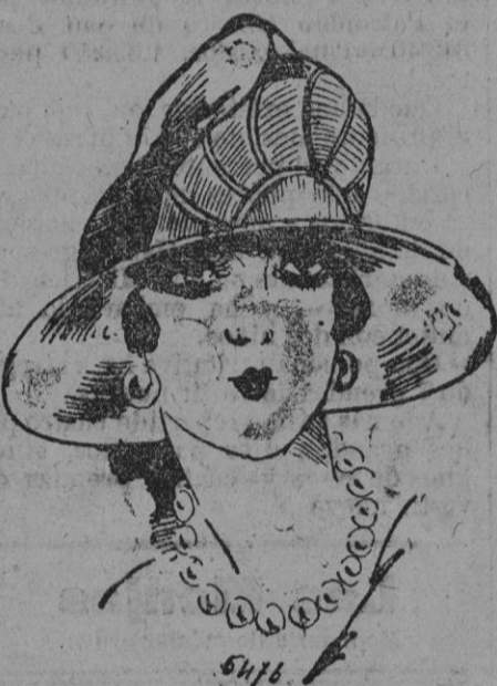
SOMBRERO.—Una deliciosa capelina de Lewis, de papa a fondo muellemente drapado cuyo movimiento es subrayado por una flor de grueso grano negra incrustada y orlada con piel dorada.