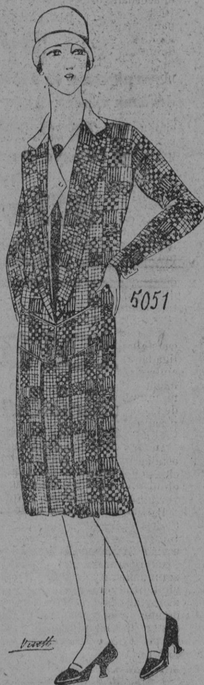
ABRIGO.—Abrigo de lanaje de fantasía eslabon y azul real, la ancha cintura ciñe estrechamente las caderas. El cuello chal muy abierto deja apercebir un chaleco de piel, azul.

Ella.—Sus papás ¿son muy severos con usted?