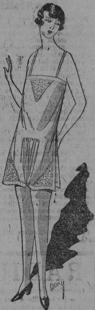
CAMISA-PANTALON.—Hallamos en esta figura una juvenil composición. Nos gustará vestir esta coqueta camisa-pantalón de lino malva pálido incrustada con triángulos de Venecia, lo que demuestra una vez más la verdadera elegancia que reside en la mayor sencillez.