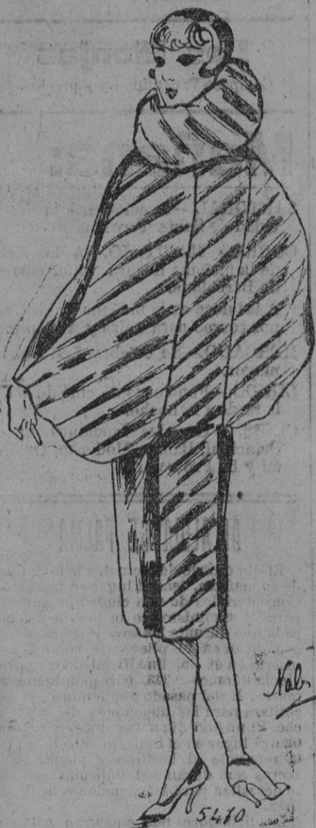
ABRIGO DE PIEL.—Vestido combinado con efecto de espalda en mar-ta zibelina y nutria afeitada.

Una figura parisina no puede mantener su rango si no tiene más o menos contacto con la literatura. Josefina Baker, a pesar de no conocer más que cuatro o cinco palabras francesas —chic, toilette, robe de soir, rue de la Paix— se ha dado cuenta de esta particularidad, de la vida artística de la capital francesa y ha tratado de velar por su prestigio. La danzarina mulata ha empezado a escribir sus memorias que aparecerán primero en francés y después en inglés. Un editor parisien se ha comprometido a publicar en breve el libro. La Baker trabaja todas las mañanas en su primera obra. En realidad no escribe ella misma, sino que ha confiado sus impresiones a un periodista francés que conoce a fondo el inglés y que se encarga de dar a los recuerdos de la estrella cierta forma literaria.