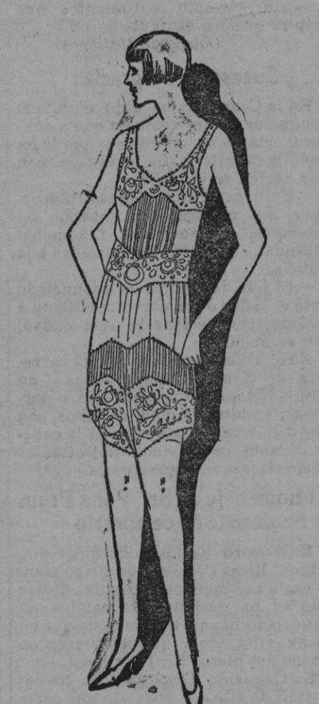
CONJUNTO.—Es de notar la forma nueva y joven de esta encantadora camisa-pantalón que nos dará un poco aire de suave. Es concebida de velo de seda tiple rosa té. El bajo de las piernas, la cintura y el aplique son rebordado tono sobre tono. Pequeños pliegues acaban de dar al conjunto un seductor cachet de originalidad.

lleven para entregarse a él deben ser sencillas pero de buen corte. Si se ha de tomar parte activa en la caza hay que escoger telas de tonalidad neutra, que no sean muy visibles a gran distancia porque los conejos, perdices, etc. se alarman en cuanto ven una mancha de color detonante. Los tejidos de lana marrón beige o verde oscuro son los más indicados para los trajes de caza. La falda será corta, montada con pliegues a fin de que tenga la holgura necesaria para no impedir la libertad de movimientos. Como prenda de cuerpo, la más conveniente es la vareusa con pliegues y cinturón de la misma tela, aun cuando puede sustituirse éste por una trabilla fina. El sombrero debe ser de fieltro, desprovisto de todo adorno, pero de forma graciosa. En el calzado no cabe gran coquetería. Hay que decidirse por la bota alta de becerro suave rematada por polainas o vendaditas alpinas.