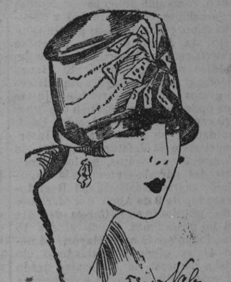
SOMBRERO.—De José, sombrero para vestir, de tafetán negro, adornado con un motivo pintado y diamantado.

Las formas son más sencillas. La forma blousante constituye la novedad de la temporada. Con frecuencia dicho movimiento sólo se advierte en la espalda y ello da a la silueta una sugestiva originalidad. Algunas cosas importantes que se distinguen por la audacia de sus creaciones han situado el tallo en su lugar natural, pero no podemos decir todavía si la innovación prosperará como algunos modistos esperan.