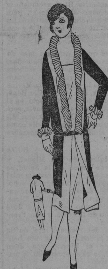
TUNIGA.—Túnica verde, combinando el tono claro con el intenso, guarnecida con plisados, cerrado con un cinturón fantasía.

No hay que olvidar que la caza es un deporte y que las prendas que se