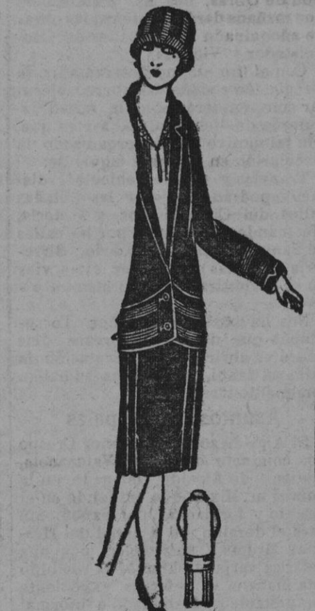
Talle ap kashatoll guarnecido con ones del mismo tono.