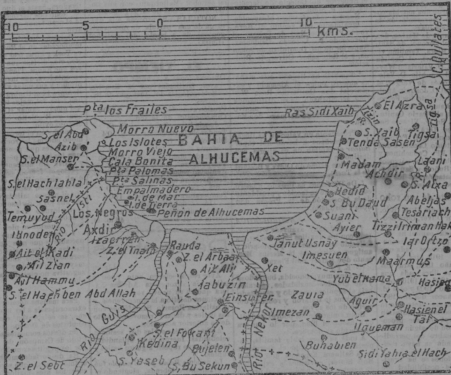
La costa rifeña entre Cabo Quilates y Gomara, donde desembarcaron las tropas españolas.