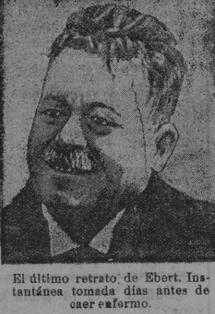
El último retrato de Ebert. Instantánea tomada días antes de caer en forma.