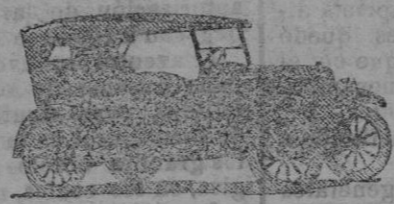
Torpedo Chevrolet 7.000 pesetas