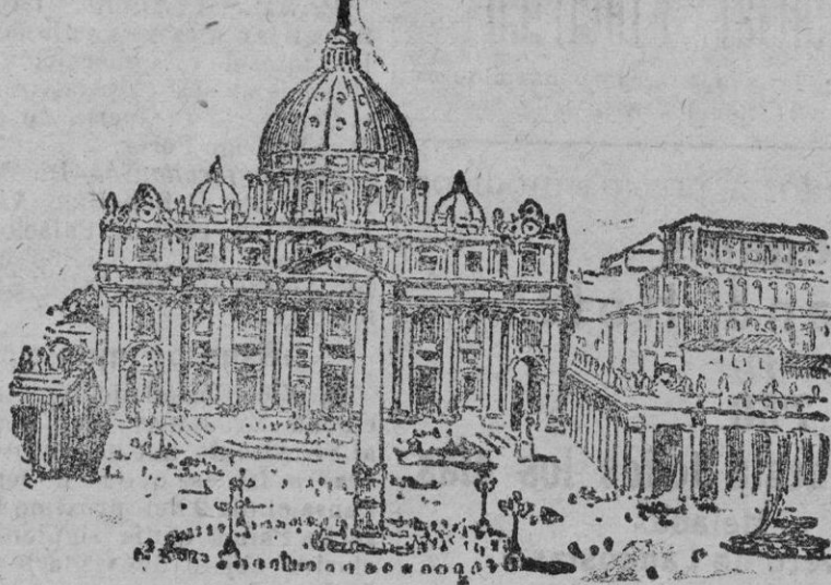
Basilica de San Pedro, donde provisionalmente se ha dado sepultura al Papa Benedicto XV.