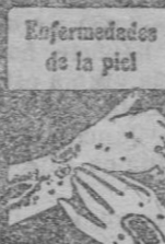
Enfermedades de la piel

Cada frasco va acompañado de un folleto ilustrado. De venta en todas las buenas farmacias y droguerías. Laboratorio L. RICHELET, de Sedan, 6, Rue de Beaufort, Bayonne (Francia).