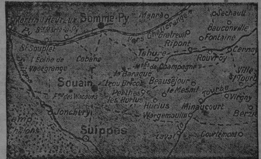
Mapa del teatro de operaciones en Champagne.