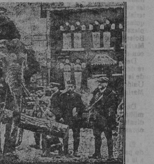
Elefantes de una mensajería transportando objetos para la guerra