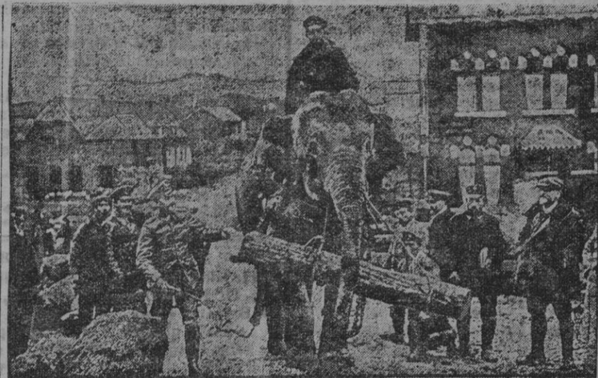
Elefantes de una mensajería transportando objetos para la guerra