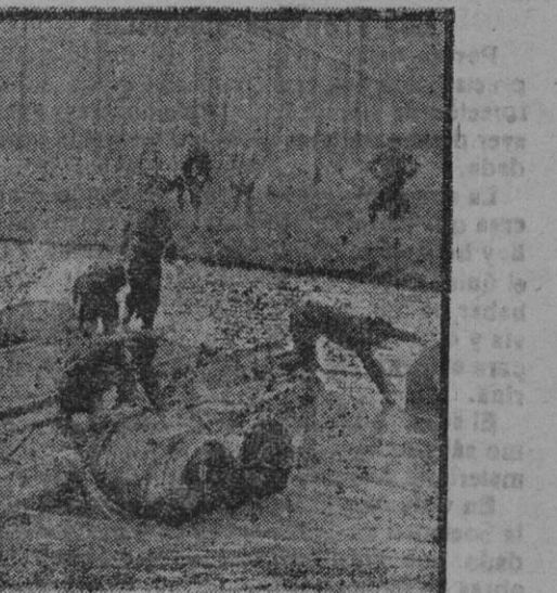
Marinos construyendo un paso sobre el río Iser