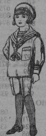
Trajes de jerga azul bordado oro en la manga para niños de 4 a 9 años. De pts. 20 a 22