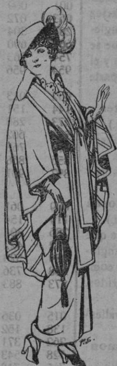
Capas de lana para Señoras. Pesetas 20