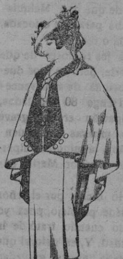
Capas de lana para jóvenes de 13 a 16 años. De pesetas 25