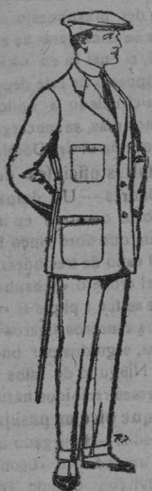
Trajes de cheviot, corte elegant para «Spormen». De pts. 45 a 55