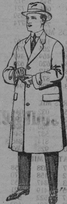
Gabanes en tejidos pluma ratón, etc. De pts. 30 a 100