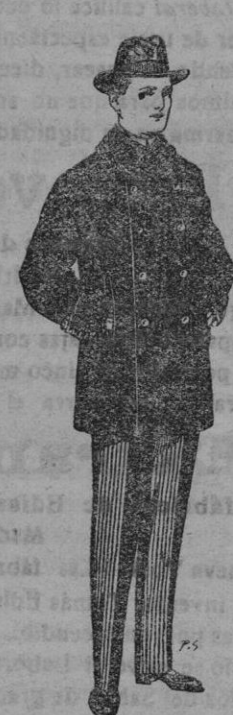
Pelissas con cuello y bocanangas astrakan. De pts. 11 a 90

Gorras, Sombreros, Cinturones, Calcetines, Corbata, Fajas, Ligas, Tirantes, etc., etc.