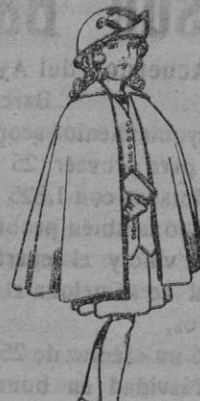
Capas de lana para niñas de 4 a 12 años. De pts. 20 a 22.