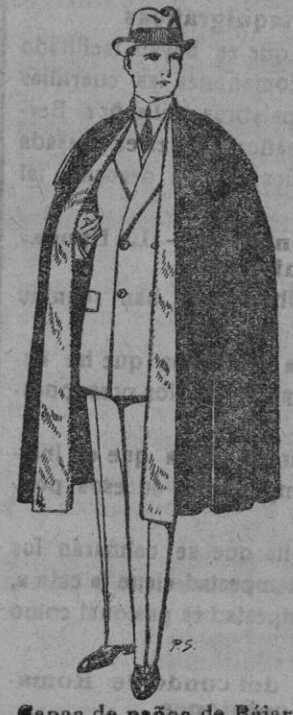
Capas de paños de Béjar y Tarrasa. De pts. 25 a 100