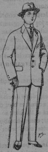
Trajes de patén, vicuña, etc., para niños de 10 a 16 años. De pts. 13 a 48