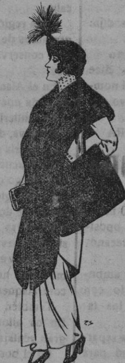
Juego de pieles de Centre du Nord para Señora. Pesetas 145