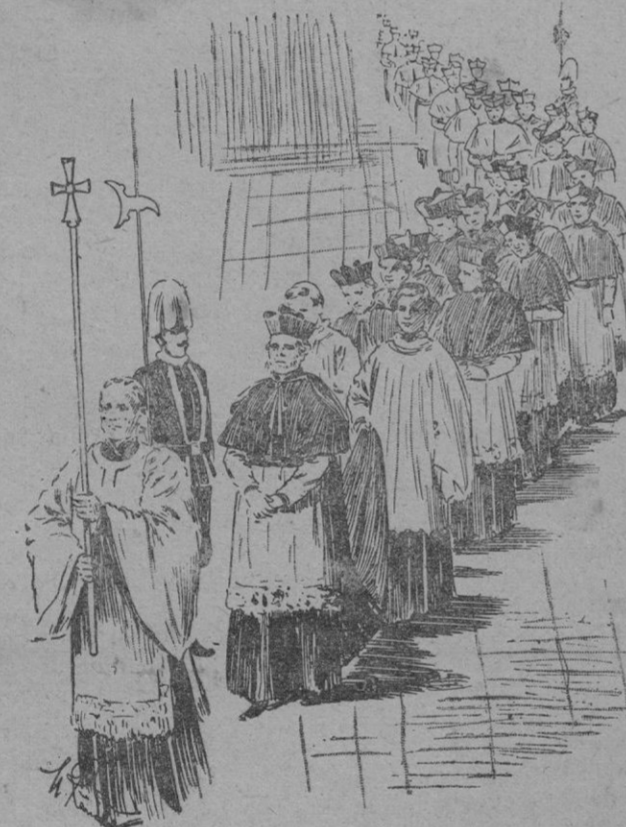
Entrada de los cardenales en el Cónclave

orden de jerarquía y precedidos por la cruz pontificia, entran en el recinto del Cónclave.