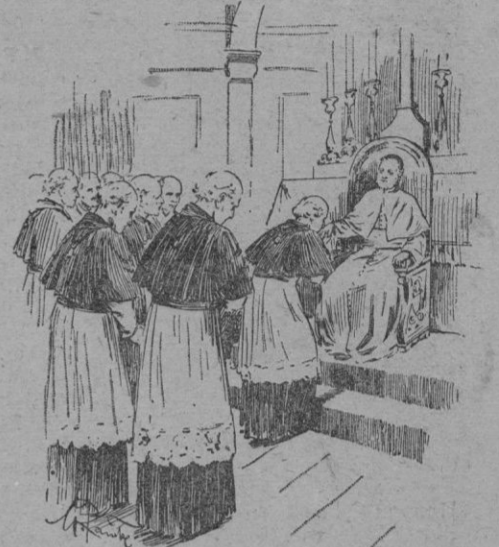
Los Cardenales adorando el Papa

de la cual se da audiencia á los embajadores. La puerta del Cónclave sólo puede abrirse para que entren los cardenales