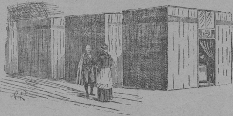
Las celdas de los Cardenales durante el Cónclave

El Cónclave se estableció en el siglo XIII, á la muerte del Papa Clemente IV y fué debido á que los pareceres de