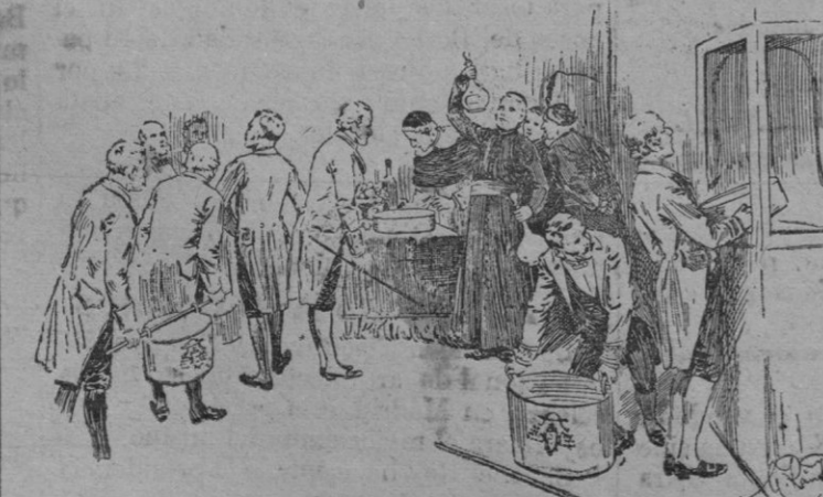
Revisando los alimentos para ser llevados al Cónclave

La transformación profunda que durante el reino de Pío IX sufrió el Pontificado