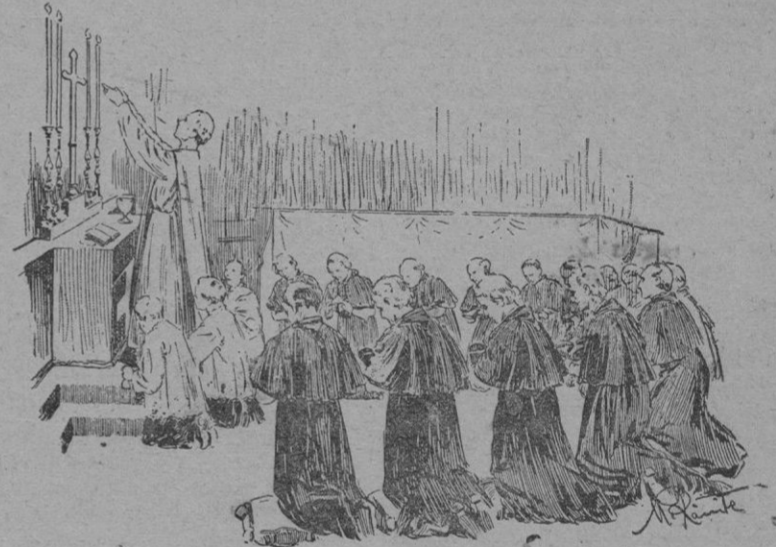
La misa del Espíritu-Santo antes de empezar el Cónclave

Las celdas están tapizadas de zarga verde y de la misma tela, morada, las de los cardenales creados por el Papa que acaba de fallecer. Después de numerarlos se sortean, colocando en la puerta de cada uno de ellos las armas del cardenal que haya de ocuparla, tapiándose antes todas las salidas de modo que