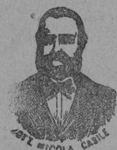
Inventor de los renombrados medicamentos CASILE

Anglada y Llauger, antigua casa de Can Bit a, Jaime II, núms. 113 y 115