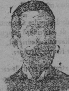
D. y. actúa, 435, Barf.

INYECCION ANTIVERNEAOS Y ROSE ANTISIFILITICO COSTANZI