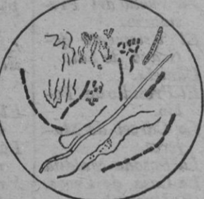
Varias formas de bacterias de la boca.